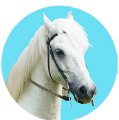
Paarden van de Bataven