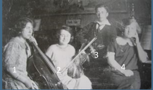
Het kwartet van Boort