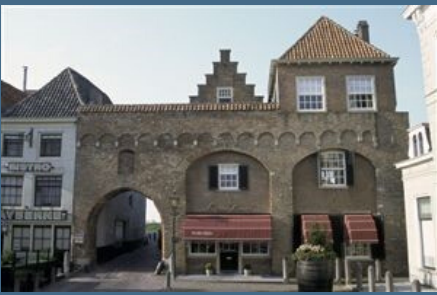
Bron E: de waterpoort

D. Bekijk bron E. Welk pand stond vroeger bekend als de Roscam? Wat was de Wildeman?