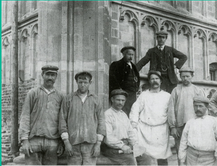
Bron K: werklui bij de Sint Maartenskerk