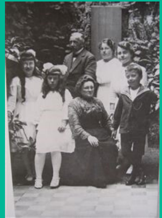
Bron C: gezin van Boort

B. Bekijk bron B en C. Hoe heten de personen die donker gekleed zijn?