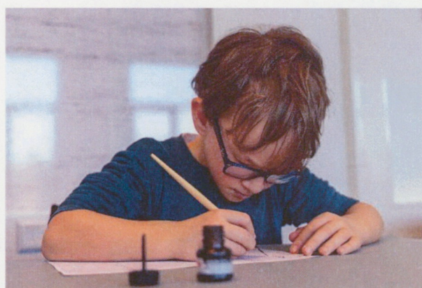
educatieve programma's voor scholieren bij het RAR