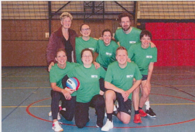
Team RAR tijdens de collegiale intergemeentelijk volleybal wedstrijd